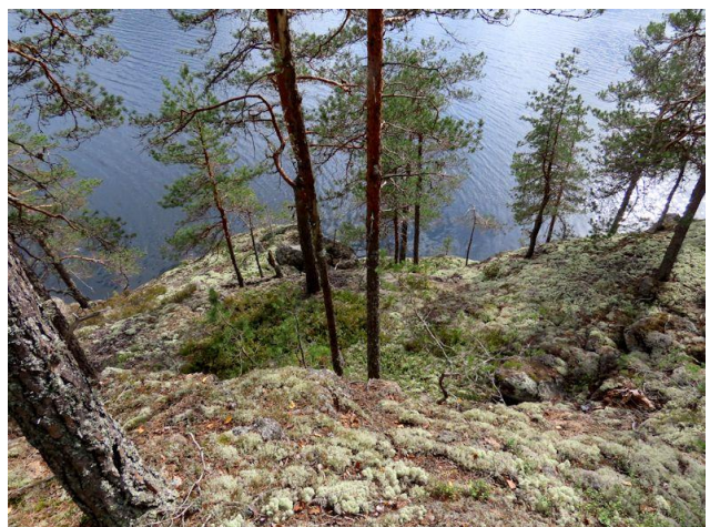
Kuva 6. Länsirannan CIT-männikköä Nuottasaaren pohjoispäässä.